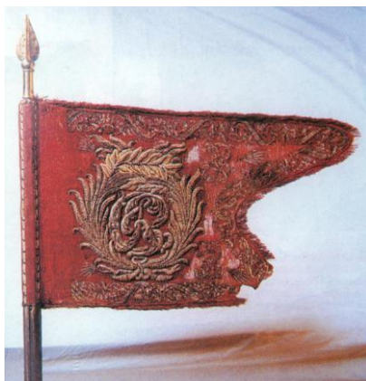
Savoyai Jenő hercegről elnevezett dragonyos ezred zászlaja

Külön teremben állítanak emléket a híres hadvezérnek, Savoyai Jenőnek.