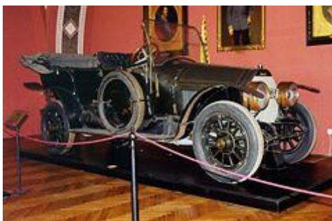
A gépkocsi, amelyben a trónörökösét és feleségét a halálos lövések érték Bécsi Hadtörténeli Múzeum

A XIX. századi teremben a szép huszár ruhákban gyönyörködhetünk. Teljes és tökéletes gyűjtemény állít emléket Ferenc Józsefnek és korának. A színes, szinte vidám hangulatú terem után egy egyszerű, szürke következik, amelyben egy, a világot megrázó esemény relikviái láthatók. Középen Ferenc Ferdinánd golyóütötte zubbonya, a fal mellett a nyitott Gráf-Stift autó a becsapódás nyomaival. Ebben a teremben Szarajevó 1914. június 28-a elevenedik meg.