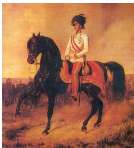
Ferenc József (Albrecht Adam festménye)

1891. május 25-én Ferenc József nyitotta meg a Császári és Királyi Történelmi Fegyvermúzeumot.