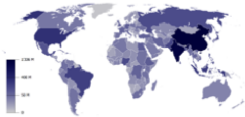
A Föld országainak népessége

Ismét a szakirodalmakban felbukkanó értelmezésekből célszerű idézni: „Ha történelmünket egyetlen napnak képzeljük, amely az előemberek megjelenésétől kezdődik, akkor több mint 23 órát már eltöltöttünk a földi paradicsomban. 23.58-kor (huszonhárom óra ötvennyolc perckor) jelenik meg a mezőgazdaság az ember történelmében, amikor is települések is kialakulnak. Egy perccel éjjél előtt feltaláltuk a kereket, 40 másodperccel a nap vége előtt megrendeztük az első olimpiát, harminchét másodperccel később a Holdra léptünk, és egytized másodperccel éjjél előtt kezdődött el az internetezés.”